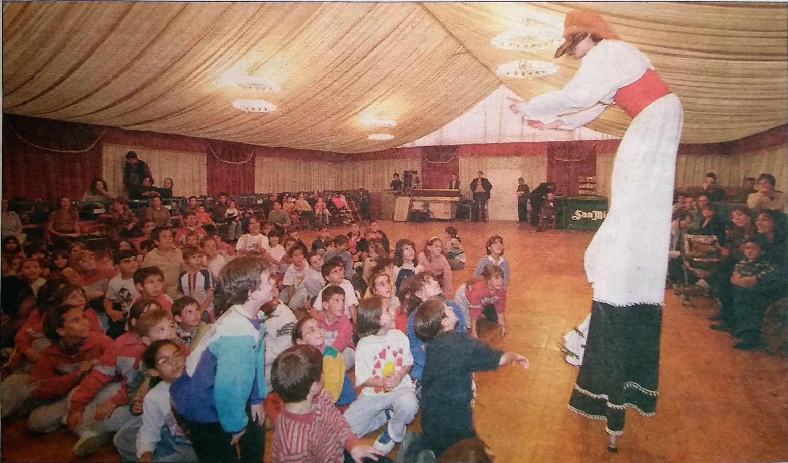
Xarop de canya, ahir al matí a l'envelat muntat a la plaça Major. La Fira d'Espectacles d'Arrel Tradicional és present en escenaris de tota la ciutat