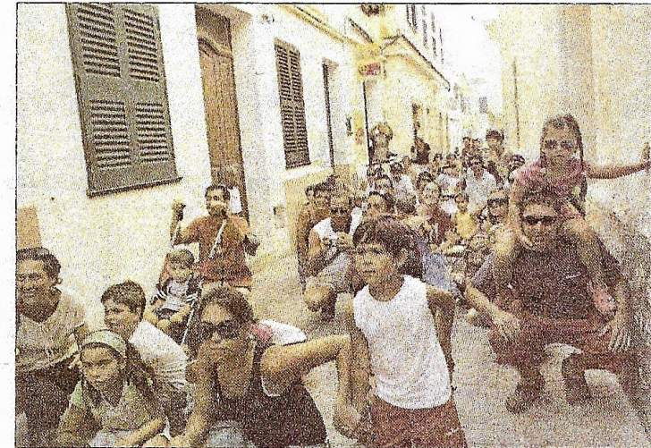
El público colaboró agachándose cuando el grupo lo pidió.