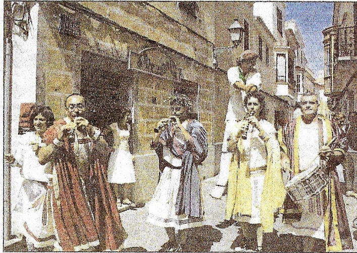
Animaron a todos los transeúntes del centro urbano.