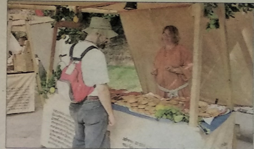
Acróbatas, malabaristas, zancudos y cabezudos animan el mercado artesanal que en torno al Passeig de Sagrera permite ver y degustar los más variados productos de Balears.