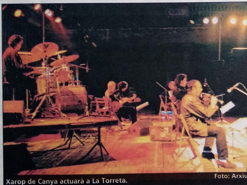
Xarop de Canya actuarà a La Torreta.

O'Jarbanzo Negro es va fundar l'any 1993 quan un gallec i dos extremenys, armats amb gaites i tambors, van decidir unir-se amb l'objectiu de fomentar l'art i, especialment, l'intercanvi cultural i el compromís social. Més tard, s'hi va incorporar el cantant del grup A Palo Seco. O'Jarbanzo Negro passa de l'estricta espectacle acústic i folklòric fins a l'electrònica i la barreja d'estils tant diversos com el rap, l'ska, el punk, la rumba o el jazz. Els montmelonencs podran ballar tots aquests ritmes el divendres 27 de juny, a les dotze de la nit, als jardins de La Torreta. El grup galaicoextremenys serà precedit, a dos quarts d'onze, per Xarop de Canya, una de les ban-