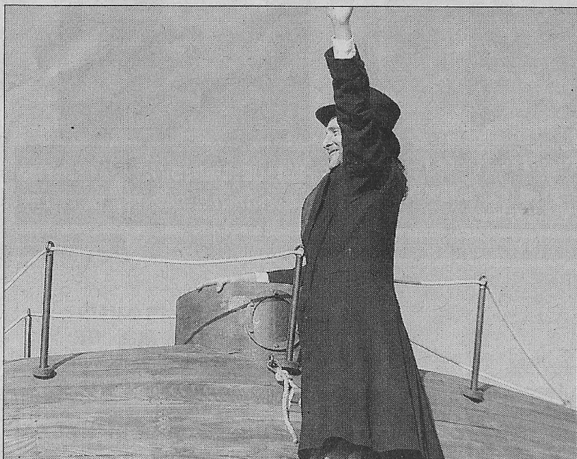
El personatge de Monturiol, a sobre l'Ictineu I

El grup de música tradicional presenta 'Ictineu I. El somni de Monturiol'