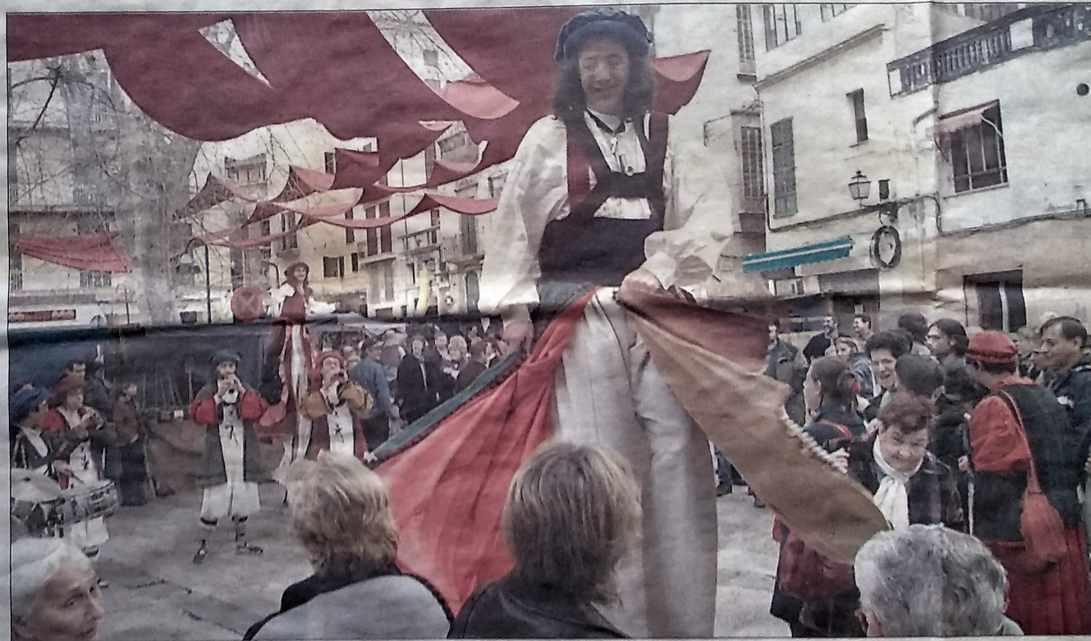
Los músicos y los actores en la animación de calle. Actores mallorquines dieron vida a personajes populares del siglo XIX mientras que el grupo Xarop de Canya de Barcelona alegraba y animaba con su música de «gralles» y percusión a los viandantes que circulaban por el recinto de sa Llonja y plaza Draçana.