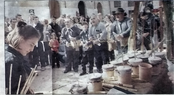
Los «poblers» animaron la plaza Draçana con cantos de «ximbomba».